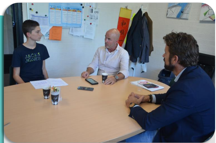
Het interview met meneer Neutelings en meneer Gardeniers