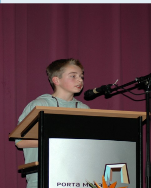
TTO leerling achter spreekgestoelte tijdens Public speaking contest